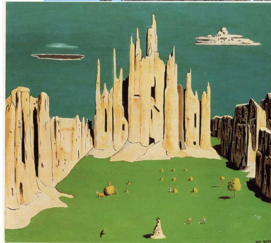
Dino Buzzati, Piazza del Duomo di Milano, 1958